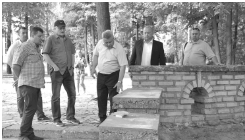
Глава района проводит инспектирование качества проведения работ