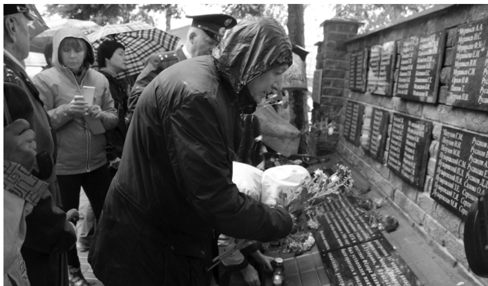
К мемориалу, который в этом году получил новую жизнь, были возложены цветы и венки, зажжены поминальные свечи